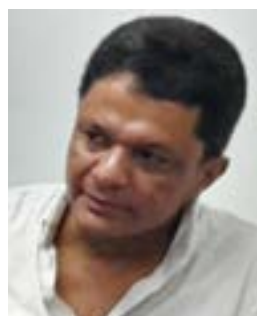
Wellington Barbosa Residencial