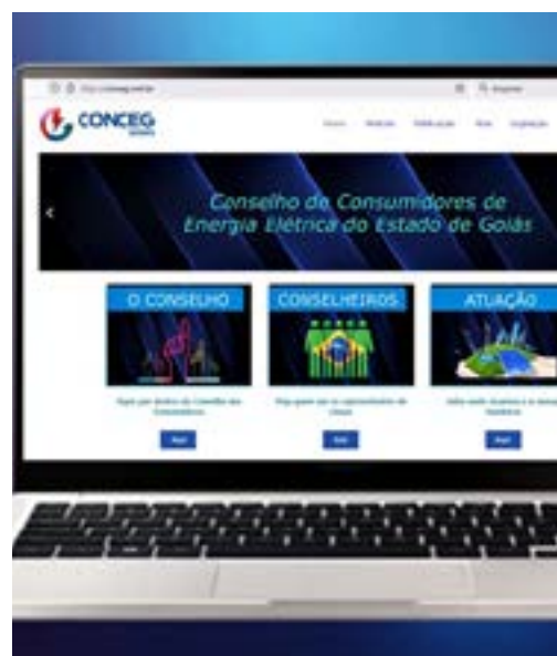
Site registra expansão de acessos