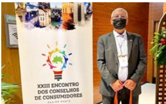
Representação em encontro da Região Norte

* O Conselho de Consumidores de Energia Elétrica do Estado de Goiás (CONCEG), reuniu seus membros no dia 31 de maio, para a apreciação de aprovação das contas da entidade, referentes ao ciclo de janeiro a abril de 2022. Os conselheiros fizeram a análise dos balancetes apresentados na reunião, os quais foram aprovados se ressalvas.