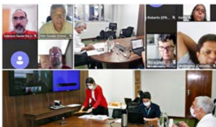
Encontro para apreciação e aprovação de contas