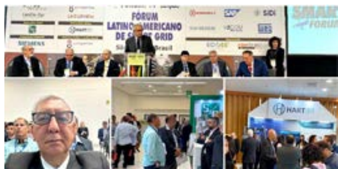
CONCEG participa do Smart Grid, em São Paulo