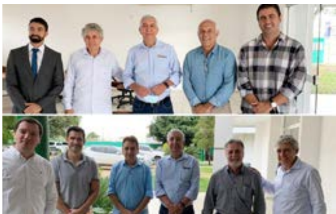
Encontro com representações do DAIA em Anápolis

* O Conselho de Consumidores de Energia Elétrica do Estado de Goiás (CONCEG) realizou, no dia 22 de fevereiro, a primeira reunião ordinária do ano de 2022. Ainda devido a pandemia, o encontro foi realizado de forma virtual. A Resolução 1000 e as demandas da área rural pautaram o encontro.