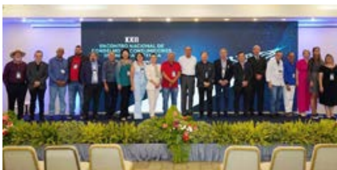
Conselho segue com representação no Conacen

* A assessoria do Grupo Equatorial Energia lançou um comunicado sobre a troca de controle acionário da concessão da Celg-D, que pertencia à Enel Goiás. Foi anunciada a data de 3 de janeiro de 2023.