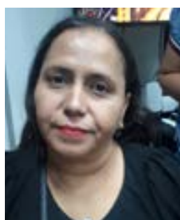
Keitty Abreu Residencial