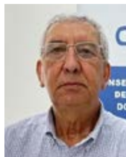
Wilson de Oliveira Industrial