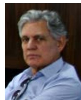
Sílvio Oliveira Industrial