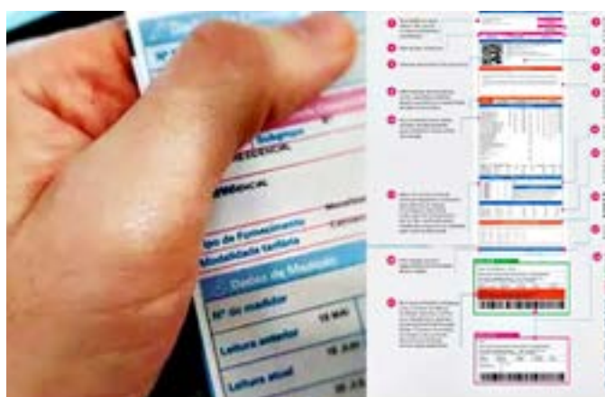
Consumidores recebem novo modelo de conta